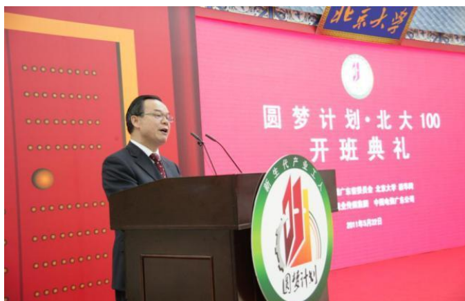
时任北京大学校长周其凤院士参加“北大100”开学典礼

作为“圆梦计划”的发起高校，北京大学现代远程教育广东教学中心办学过程中坚持引入和探索科学、规范的管理模式、树立质量意识、提高管理水平和工作效率，遵循“一切为了学生，为了一切学生，为了学生的一切”的服务宗旨，强化学习支持服务，深受学生好评。