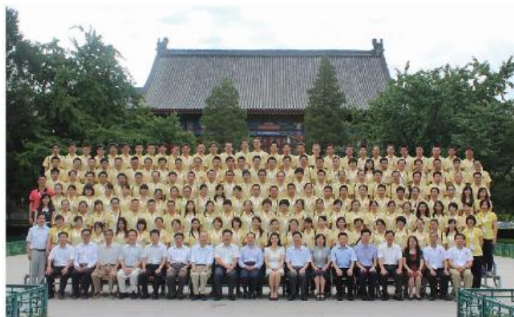
圆梦计划北大100优秀学员返校学习的留影